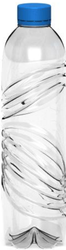
ด้านข้างขวา