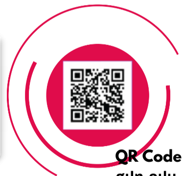
QR Code ศปท.กปน.

หากพบเห็นการทุจริต แจ้งข้อมูล - เบาะแสะได้ที่ ศูนย์ปฏิบัติการต่อต้านการทุจริตของ กปน. [ศปท.กปน.]